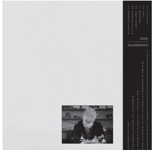
Bidai, Biarrezgaur , 2023

OE Baina tokiaren arabera da. Ni, berriz, Azpeitiko gaztetxeaz gogoratzen naiz, baina batez ere Azkoitikoaz, gaztetan han bizi izan bainintzen. Ez zegoen halako hesirik. Handik sortuko ziren Akauzazte bezalako taldeak edo Anari bezalako musikariak. Eta egia da punka gailentzen zela estilo bezala baina era berean popak bere lekua zuen, Nick Cave, La Insidia, Dream Syndicate, La Dama Se Esconde edo Talking Heads, entzutea oso ohikoa zen esate baterako.